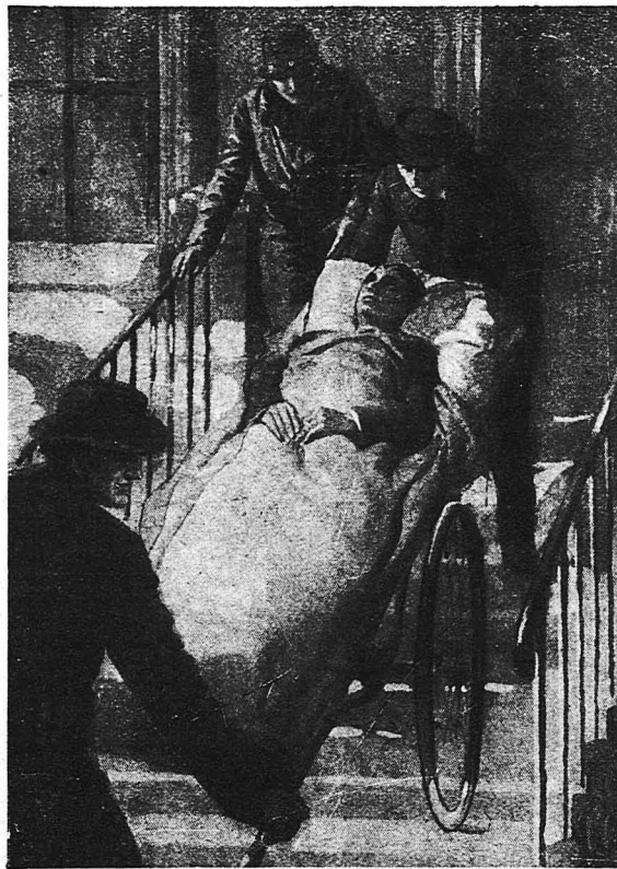
"Όταν με κατέβαζαν για να μ' έγχειρήσουν έννοιωσα μ' άλλόκοτη συγκίνηση.