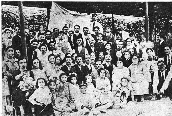
Οἱ δραστήριοι καὶ ἀεικίνητοι ἐφημεριδοπῶλαι τοῦ Πειραιῶς μετὰ τῶν οἰκογενειῶν των εἰς τὸν Ἅγιον Ἰωάννην Ρέντην.