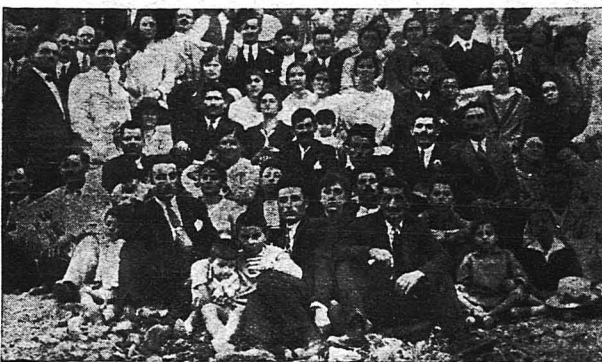
Οι συμπαθείς και ἀκούραστοι ἐφημεριδοπῶλαι τῆς πρωτεύουσας μετὰ τῶν οἰκογενειῶν τῶν εἰς τὸ Γαλάτσι.