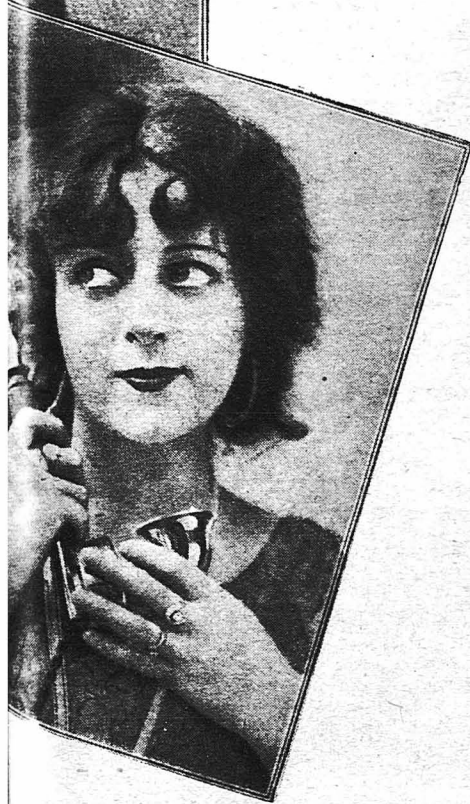
Καρολέβνα, τοῦ θεάτρου τῶν Παρισίων, οὗ πρωταγωνιστεῖ μετὰ μεγάλη ἐπιτυχία.