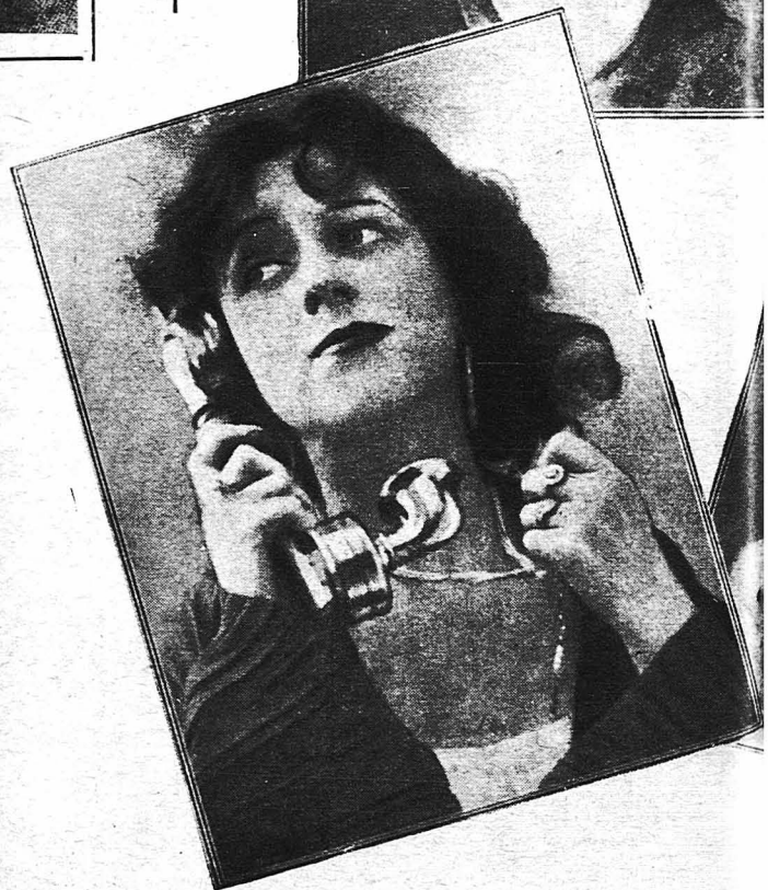
Τρεῖς χαριτωμένες φωτογραφίες τῆς διασήμου Ρωσίδος ἠθοποιῆς «Ἀμπέρ», τὴν στιγμήν ποὺ τηλεφωνεῖ στὴν κομῆτι «Ἡ ἀγάπη»