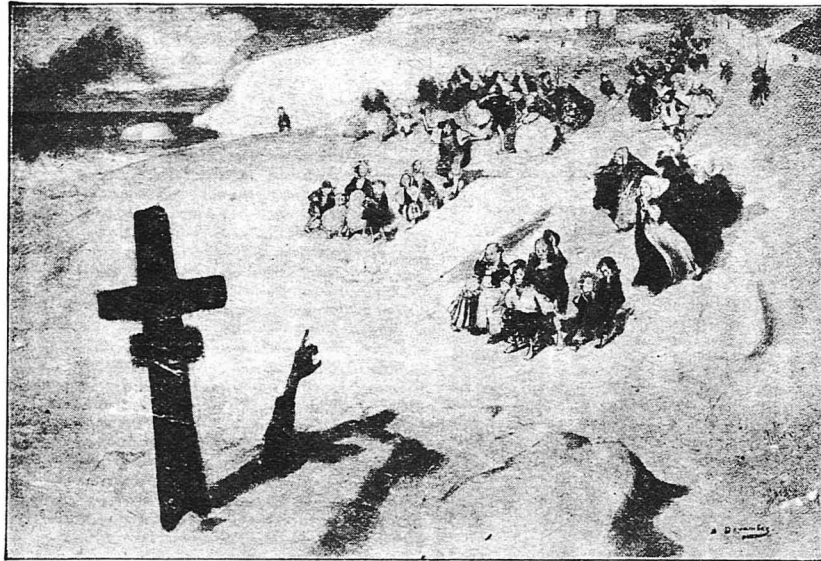
Κάτω άπ' το σταυρό ένα μανίκι βγαυει άπ' την άμμο κι' άπ' το μανίκι ένα χέρι...

Με το χέρι, που δεν ήταν τυλιγμένο μέσα σε πανιά, κρατούσε