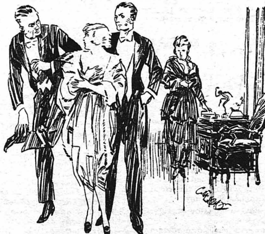
Τόν είδε να τήν κυτάρη... Τήν είχε γνωρίσει.

Η Μόνικα κατέβασε τά μάτια της κι' άνέβηκε άμέσως με το Στούαρτ στην κάμαρά τους. Ως τήν ώρα δεν είχε πῃ τίποτα τού