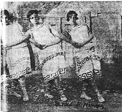
τριῶν τεθ' Ἑλληνικοῦ Σχολείου Κιάτου, νικᾶς ἐνδύμασις, μετὰ τὰς ἐξετάσεις.