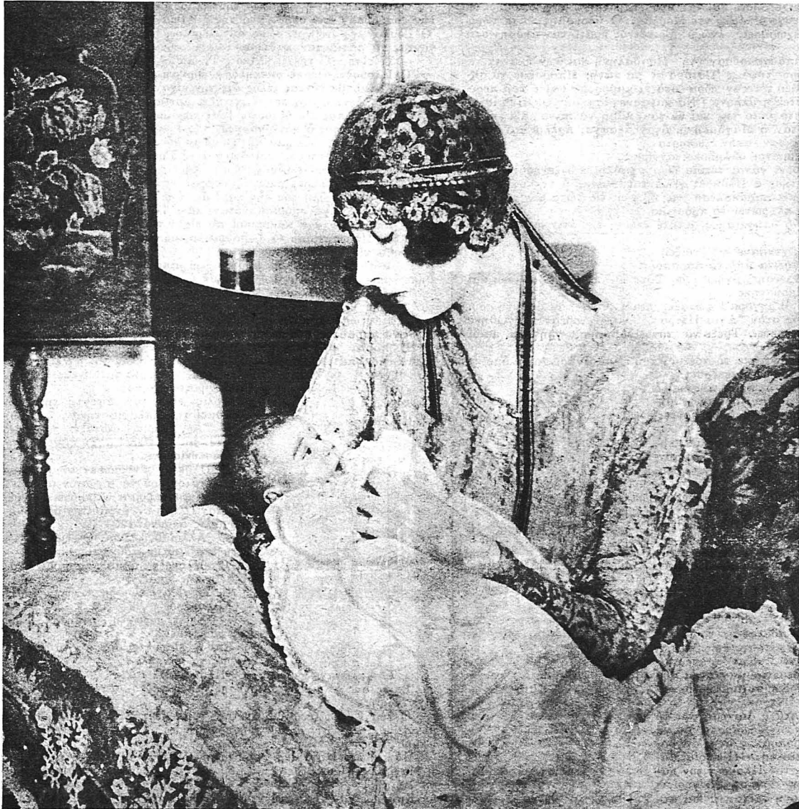
Η Λαίδη Κόμοντλυ, από τας όραιας κυρίας της άριστοκρατίας του Λονδίνου, με τó χαριτωμένο μπεμπέκο της.