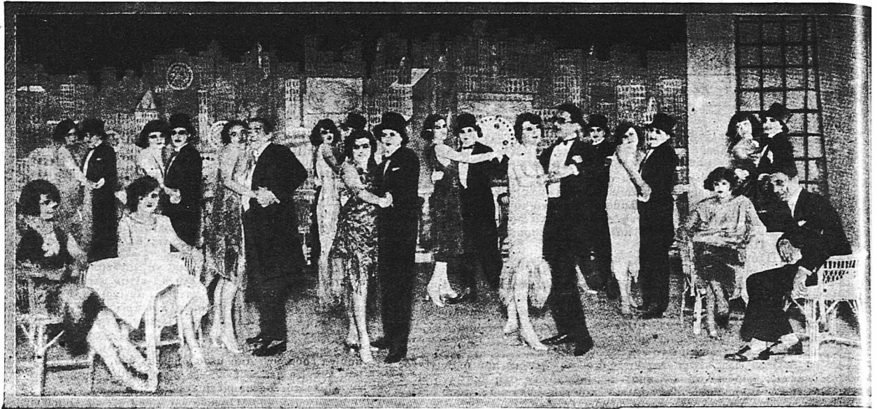
ΑΠΟ ΤΟ ΒΙΕΝΝΕΖΙΚΟ ΘΕΑΤΡΟ. - Όλος ο έθνος του Βιεννέζικου Θεάτρου «Cύδσον» επί σκηνής στο φινάλε της β' πράξεως της νέας όπερέττας «Παριζιάνικη Ζωή».