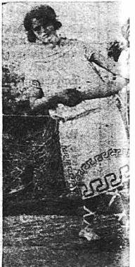
Δυό συμπλέγματα άποταί χ