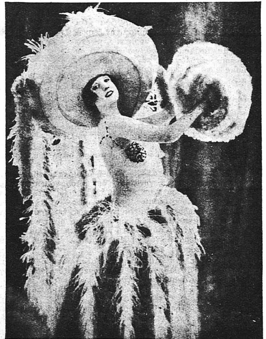
'Η μεγάλη ἡθοποιὸς τοῦ κινηματογράφου 'Εντζα Μέγκουελ.