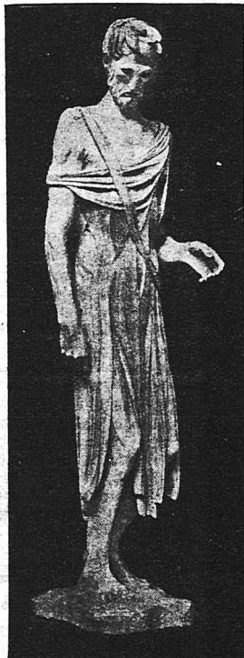
'Ο «'Ασωτος Υἱός» γλυπτικὸν ἀριστούργημα τοῦ Γερμανοῦ Γλύπτου 'Ερνέστου Χινκέλντεϋ.