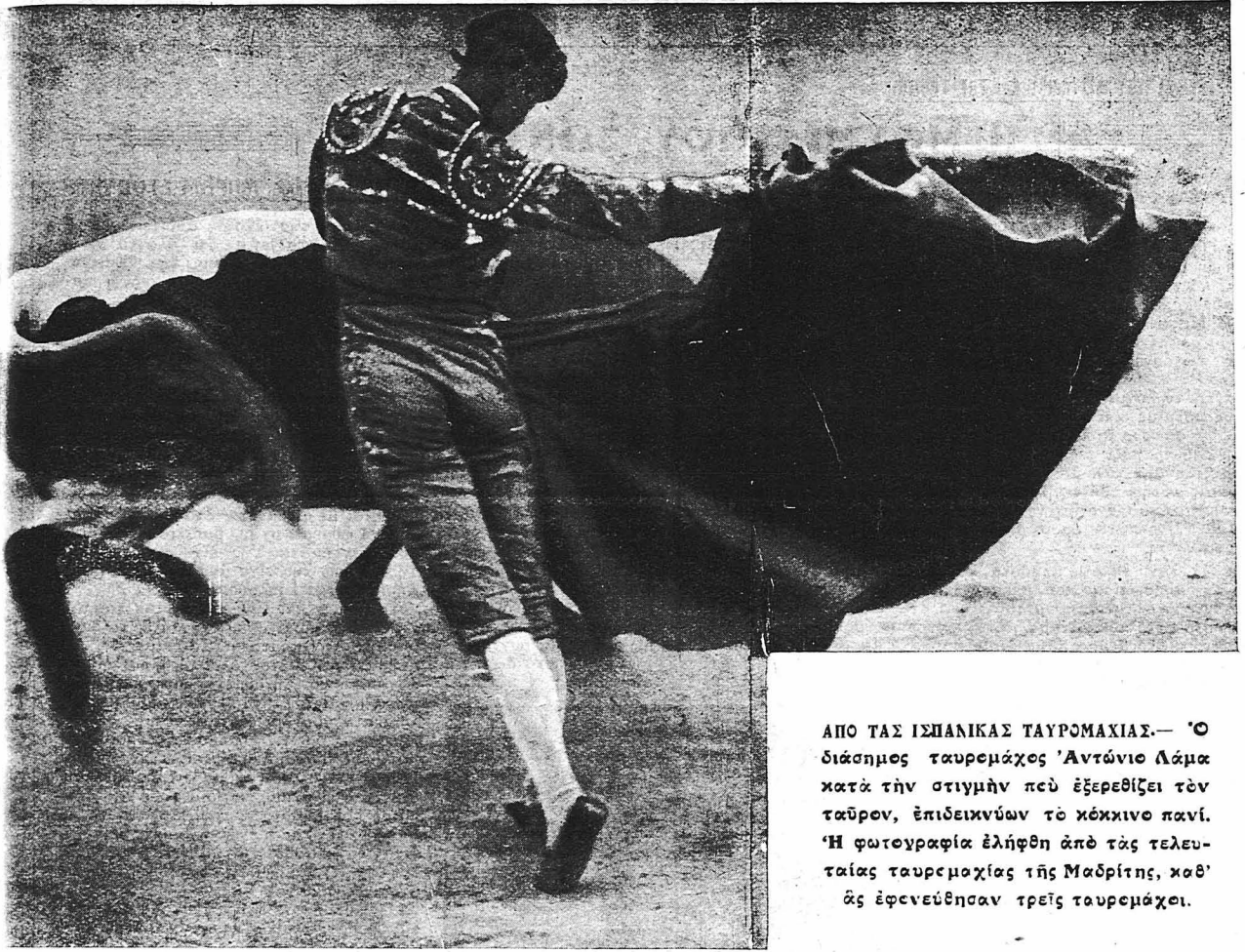
ΑΠΟ ΤΑΣ ΙΣΠΑΝΙΚΑΣ ΤΑΥΡΟΜΑΧΙΑΣ.— 'Ο διάσημος ταυρομάχος 'Αντώνιο Λάμα κατά την στιγμήν πού εξερεθίζει τόν ταῦρον, ἐπιδεικνύων τὸ κόκκινο πανί. 'Η φωτογραφία ἐλήφθη ἀπὸ τὰς τελευταίας ταυρομαχίας τῆς Μαδρίτης, καθ' ἃς ἐφενεύθησαν τρεῖς ταυρομάχοι.