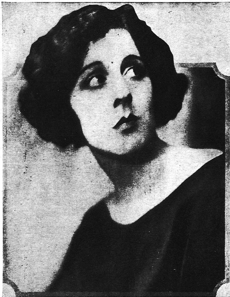
Ἡ περίφημος Ἀμερικανὶς τραγωδὸς Τζαϊνὸ Κάουλ ἡ ὁποία θριαμβεῦσι εἰς τὸν ρόλον τῆς Κλεοπάτρας εἰς τὸν «Ἀντόνιον καὶ Κλεοπάτραν» τοῦ Σαίξπηρ. Σημειωτέον ὅτι εἶνε ἡ ἑβδόμη μέλις τοῦ ἐτέλλησε νὰ κρεάσῃ ἐν Ἀμερικῇ ἀπὸ τοῦ 1846 τὸν ἐν λόγῳ ρόλον.