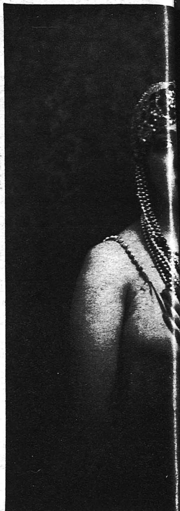
Ἡ δις Λελα Γιαννάρου, τῆς γυναικὸς μίαν ἀπὸ τὰς πλακτικὰς ἐμφανίσεως θήτρια τῆς διασήμου χειρουργίας κ. Ἰταλίου.