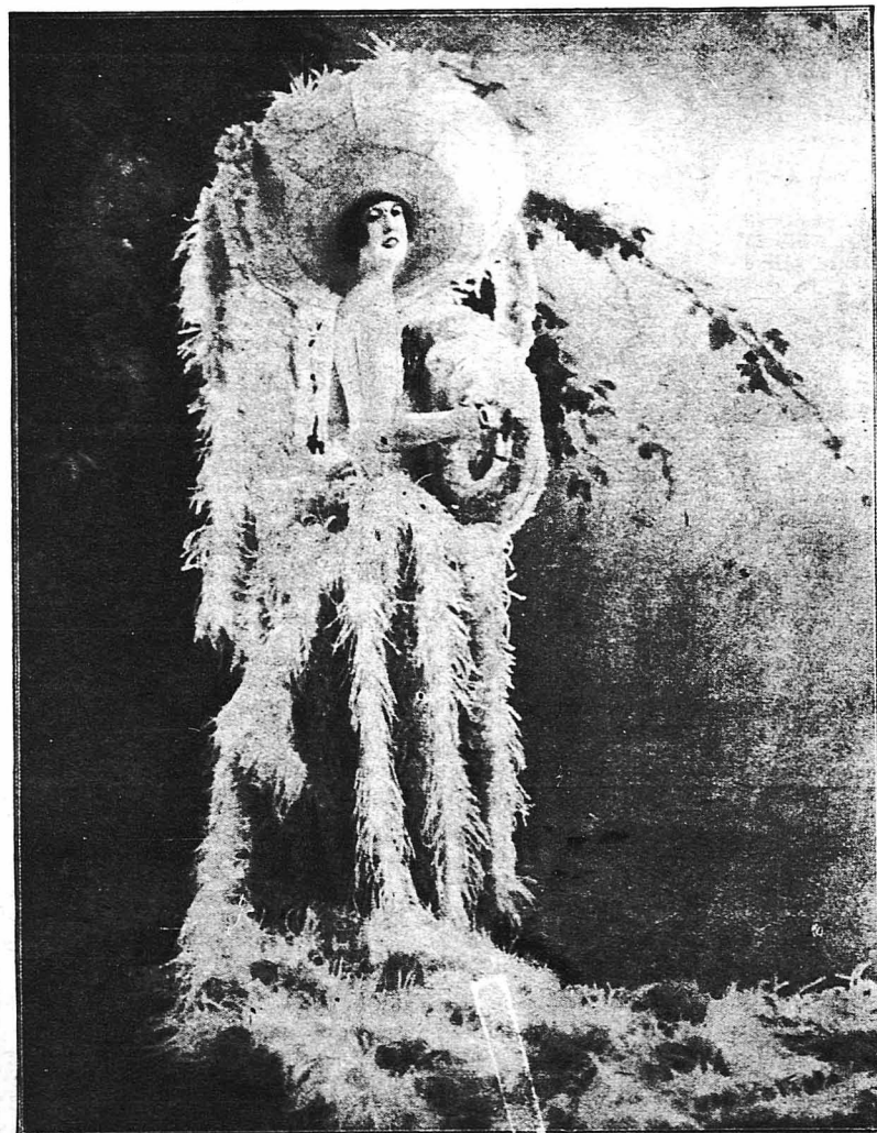
Ἡ δὲ Ἔτσα Μόγγουελ ἀπὸ τὰ λαμπρότερα ἄστρα τοῦ Βερολιναιῶν θεάτρου ἐπιθεωρήσεως.