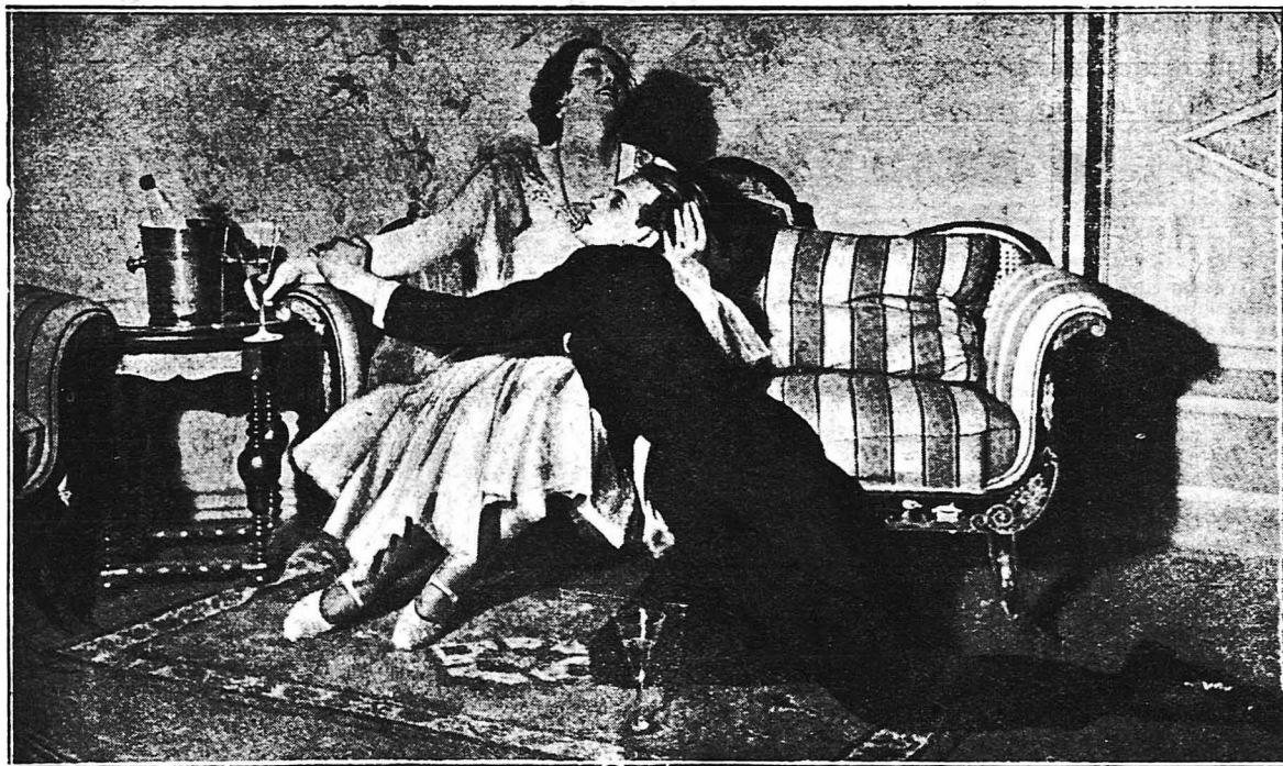
Μία παθητική σκηνή από τὸ αισθηματικὸν γάτον νέον κινηματογραφικὸν ἔργον «Τρικυμία Ψυχῶν».