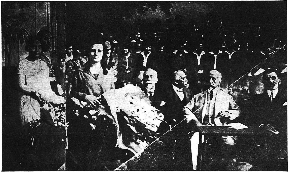
ΑΠΟ ΤΑΣ ΕΞΕΤΑΣΕΙΣ ΤΟΥ ΑΡΣΑΚΕΙΟΥ.— Ἡ ἐφερευτικὴ ἐπιτροπὴ καὶ αἱ βιβλιοθηκίσαι τρεῖς μαθήτριαι.