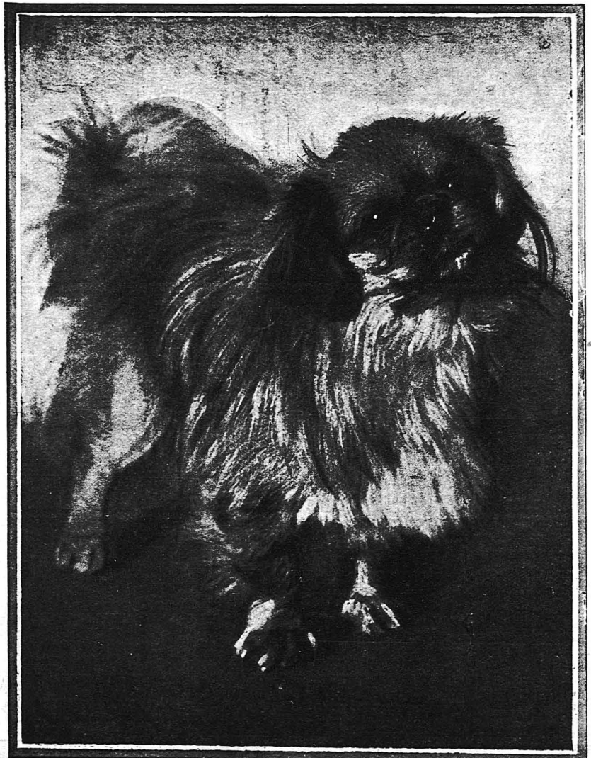
Ἡ ΜΟΔΑ ΤΩΝ ΣΚΥΛΙΩΝ.— Ἐνα κινεζικὸ σκυλάκι περιεργωτάτης ράτσας, ἀπὸ αὐτὰ ποὺ συνοδεύουν τὴς Λονδρέζας κυρίες στὰ αὐτοκίνητα. Λέγεται «Μπέϋ-Παιδάκι».