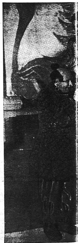
Μία σκηνή ἀπὸ τὸ κινῆμα ὅποιον παίζεται στὸ μεγάλινον. Ἡ ἡθοποιὸς ἐστὶν