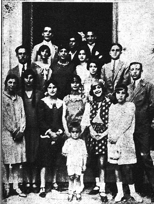
ΕΠΙΚΑΙΡΑ νίδων το κείου Με