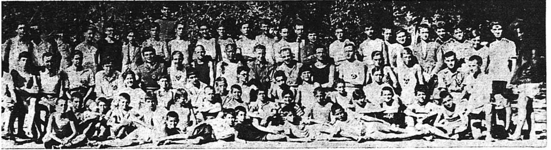
Κατασκηνωται εις τὸ Πήλιον.