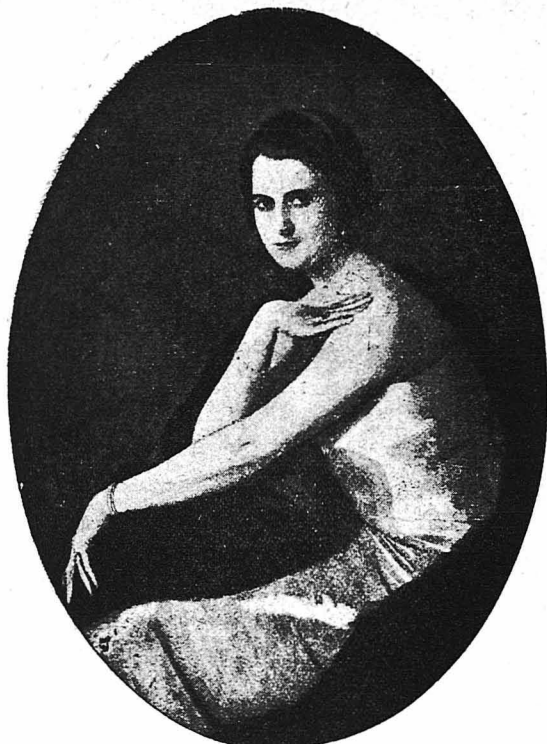
‘Η περίφημος πριμαντίνα του «Μετροπολιτάν» της Νέας Υόρκης Έλλεν Ραουθ.