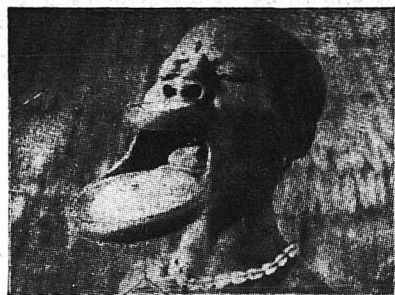
Οι γυναίκες στο Σάρα-Ντίντζε πλατάνουν με ξύλινα τασάκια τὰ χεῖρῶν τους γιὰ νὰ φαίνωνται πιὸ ὡραίες.

ΠΡΟΣΕΧΩΣ ΣΤΟ ΕΝΑ ΝΕΟ ΡΙΣΘΗΜΑΤΙ ΤΟΥ Κ. ΓΡΗΓ. ΞΕ ΚΑΙ Η ΠΡΩΤΗ ΕΠΟΧΗ ΤΟΥ «ΚΑ του ὁποῦ μόνον ἡ β' ἐπο «Μπουκέτο». Ἡ πρῶτη κὴ μὲ τὴ ζωὴ, τὸ θά κολάκισμα τοῦ εἶνε ἀσυγκρι κτικώτερο μοσιεύε