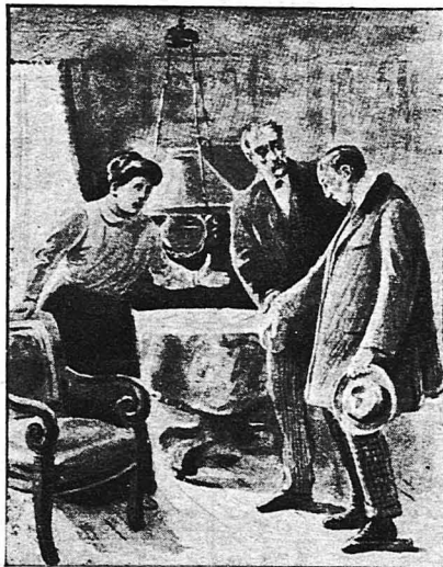
Καθῆστε, ἐδῶ εἶνε καλά...