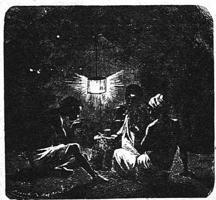
Νυχτίζται ἐργαζόμενος ὑπὸ τὸ φῶς πυγολαμπίδων