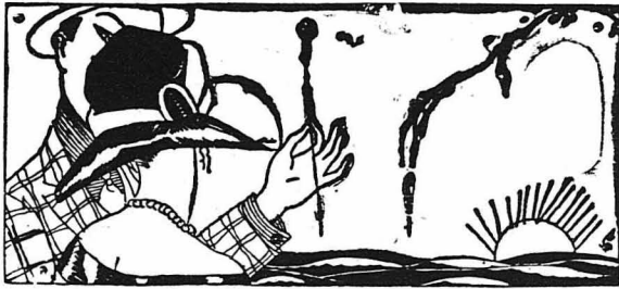
ΤΟ ΠΝΕΥΜΑ ΤΩΝ ΣΥΓΓΡΑΦΕΩΝ