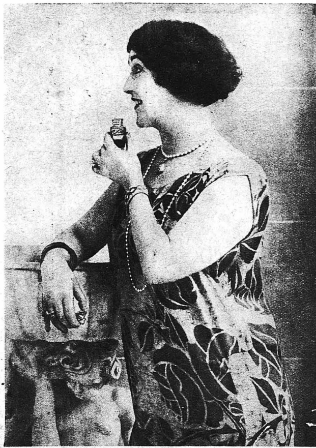
'Η μεγάλη καὶ γνωστὴ στὸ Ἑλληνικὸν κοινὸν Ἰταλίς ἠθοποιὸς Λίνα Καβαλλιέρι, ἡ ὁποία θεωρεῖται ὡς ἕνας ξεχωριστὸς τύπος τῆς λατινικῆς καλλονῆς.