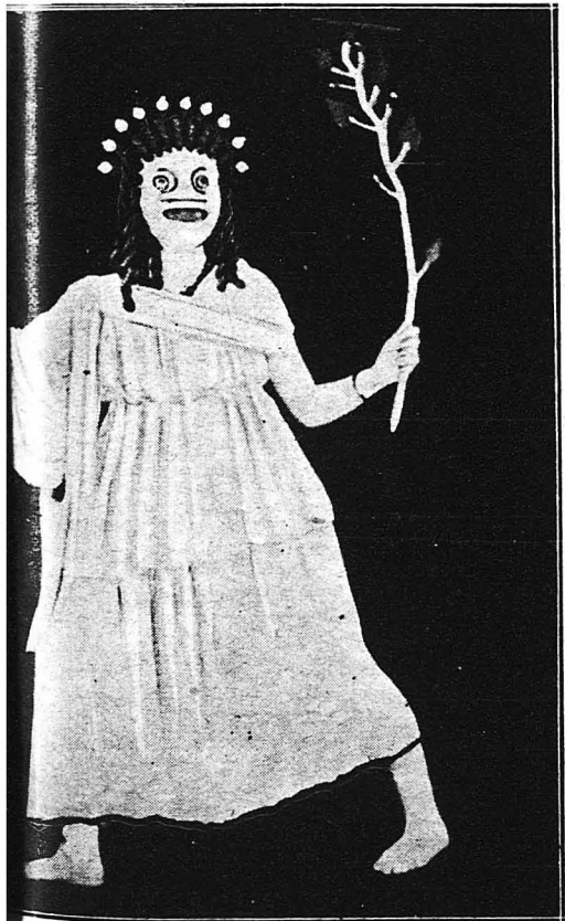
Ὁ «Ολιβερ» τοῦ Βασιλικοῦ Θεάτρου τοῦ Λονδίνου, ἡθοποιὸς Ἑλληνικὸν ἔνδυμα καὶ προσωπεῖον.