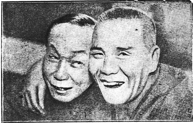
Δύο κωμικοί πρωταγωνιστές του Αυτοκρατορικού θεάτρου του Πεκίνου