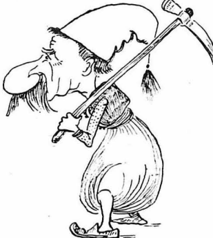
Φορτωμένος τ'ο τσαπί πήγαινε στα χωράφια