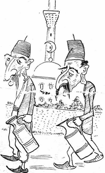
Δυό 'Αρμένιοι γερολόγοι