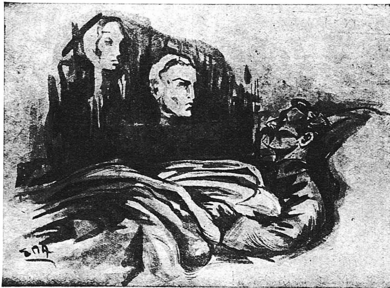
Ο στρατηγός ξύπνησε τρομαγμένος...