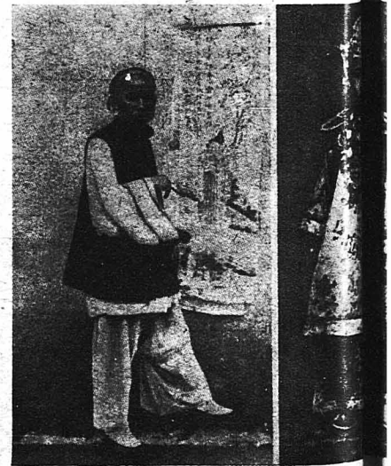
ΤΡΕΙΣ ΤΥΦΟΙ ΚΙΝΕΖΩΝ. - Κινέζος καλλιτέχνης.