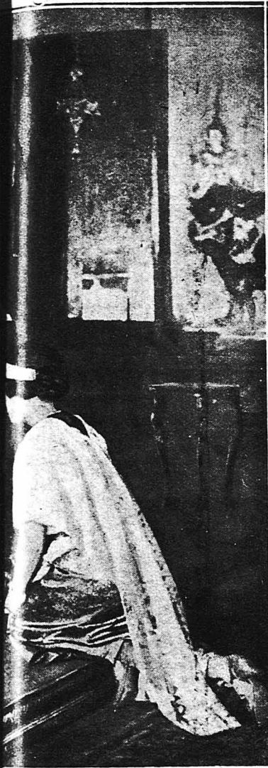
την σύζυγόν του ραντίζοντάς την με υαλού κοπέλλου ο Μέγας Αούλαρχης.