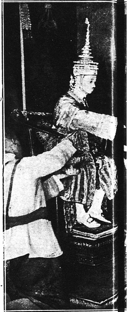
Ὁ νέος Βασιλεὺς τοῦ Σιάμ Πρανζατιπέκ, τὸ ἅγιον ὕδωρ, τὸ ὁποῖον κρατεῖ ἐν τῷ χερσίν.