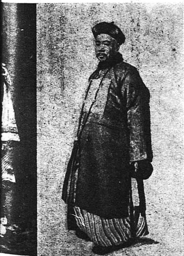
ε βαφτιστικόν κοστούμι. Κινέζος ιερέυς.