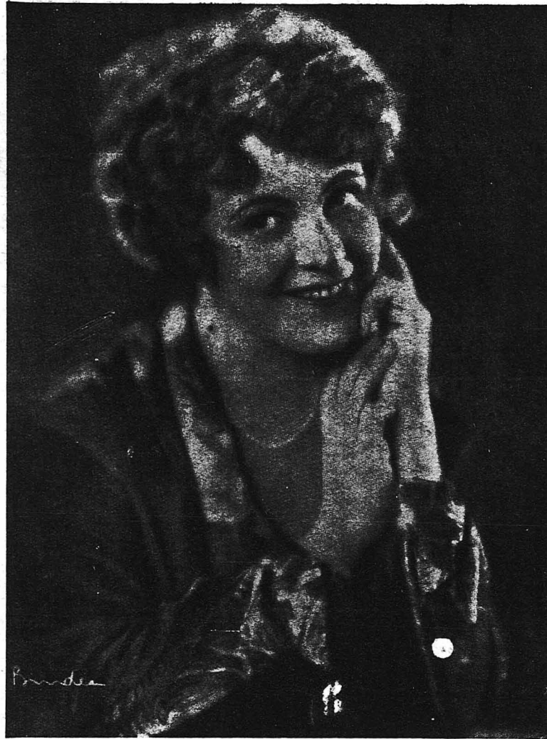
Ηγιοπευτική κ. Μαίντυ Κρίστιανς, ή όποία πρωταγωνιστεί ίς τό νέον κινηματογραφικόν Έργον «Ένα Βάλς». ]