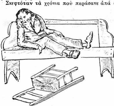
Άλano στο γυμνό πάγκο του καφενή...

Κλεισμένος μέσα στον καφενή, τον παλιό του τον καφενή, με την καπνισμένη στήλη και τις κτινινομένες τις εικόνες, ο γέρω-Μήτρος ανάλογιζότανε.