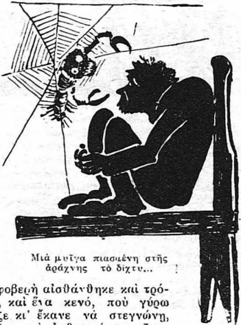
Μιά μύιγα πιασμένη σίς άράχνης το δίχτυ...