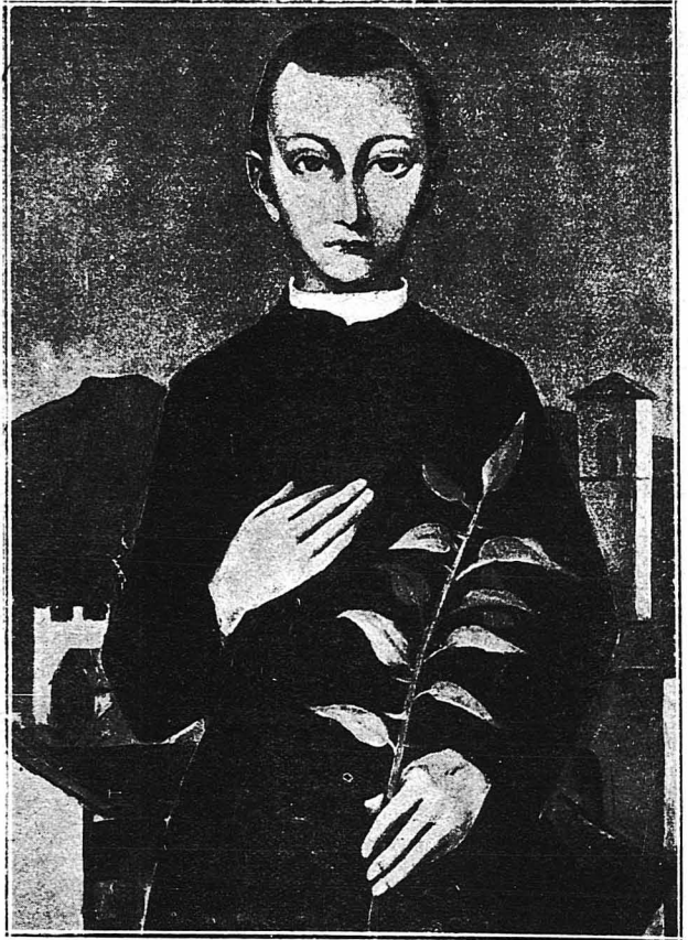
ΤΟ ΚΑΛΟΓΕΡΣΠΑΙΔΙ.— Έργον τοῦ Γερμανοῦ ζωγράφου Κάρλ Χέφερ.