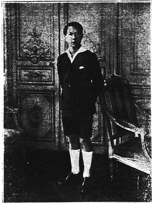
Ο εσχάτως στεφθείς νεαρός Αυτοκράτωρ του 'Αννάμ. Είς τήν μίαν φωτογραφίαν φορεῖ τὸ ἐντόπιον αὐτοκρατορικὸν ἔνδυμα καὶ εἰς τὴν ἄλλην τὴν στολὴν μαθητοῦ Γαλλικοῦ Λυκείου, ὅπου φοιτᾷ, ἐνῶ συγχρόνως ἐκτελεῖ... τὰ αὐτοκρατορικὰ του καθήκοντα !