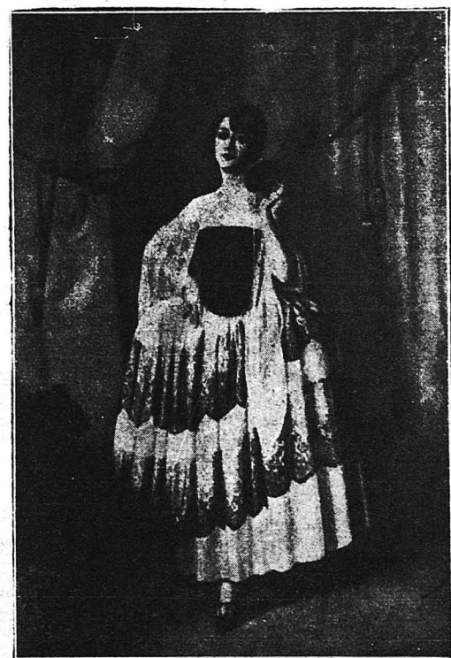
Ἡ περίφημη Ἰσπανίς χορεύτρια Πία ντέ Καστίλλανο, ἡ ὁποία παίζει στὸ «Καζίνο» τῶν Παρισίων.