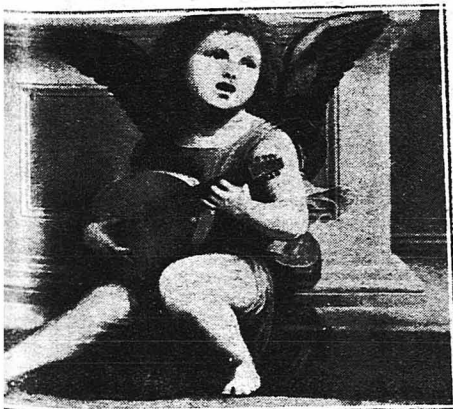
Αἰα εἰκὼν τοῦ μεγάλου προραφαητικοῦ ζω- ῳγράφου Φράνσις Βαρθολομαίου εὑρισκομένη εἰς τὴν Μητρόπολιν τῆς Λούκκας.