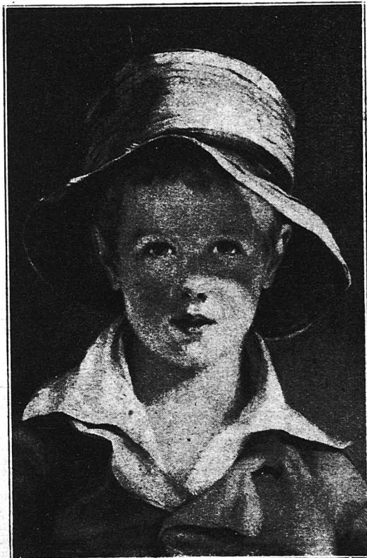
Μία θαυμασιὰ προσωπογραφία παιδιοῦ τοῦ μεγάλου Ἀμερικανοῦ ζωγράφου Γέμας Σούλλυ.