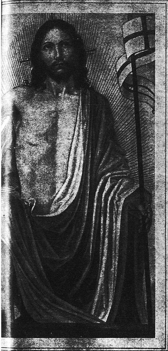
Έργον τοῦ μεγάλου ζωγράφου Ἀμπρέζιο Νταφ- νεν εἰς τὴν ἰδιωτικὴν πινακοθήκην Νικολσον ἐν Λονδίῳ.