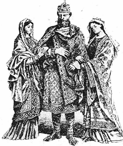
... Ἐνας φρόνιμος κ' εὐτυχισμένος Βασιλιάς...

Ἐπάνω σὸν στήθος τοῦ παιδιοῦ, ἀκτινοβολοῦσε ἕνα μεγάλο περιδέριο ἀπὸ ἀστῆρια λαμπερὰ ποὺ θαμπῶναν τὸν κόσμο καὶ