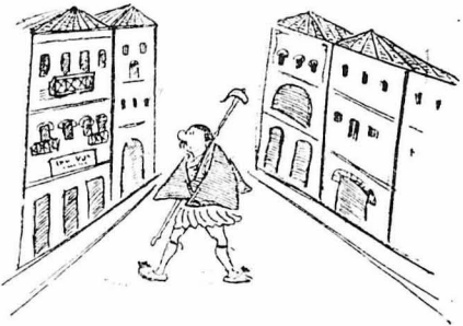
Σ' ένα φαράγγι γά έπεφτε ό Λυκομήτρος !..

Από μικρό παιδάκι δέν κατέβηκε απ' τὰ βουνά. Έστοίχειωσες, Φαρει γανείς, έχει άπάνω. Τόν ψησαν ό ήλιος, ή βροχίές, τὰ χιόνια, ή παγωνίές και τὰ δροσάπια. Τό δέρμα του είχε γείνει, σάν φλούδα από έλατακαί ή μορφή του κοκκίνισε σάν κεραμίδι. Χρόνια και «ζαμάνια» στά βουνά. Και τί βουνά! Θεώρατα, πού κουβεντιά ζα ν πάντα μέ τόν ουδανό, κι' έχαίροντο τὰ χιόνια!