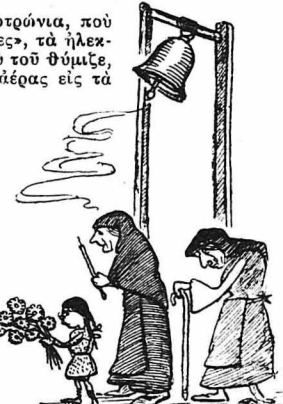
Η καμπάνες χτυπούσανε λυπητέρα.