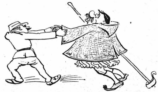
Τόν έσουρναν άπό γραφείο σέ γραφείο.