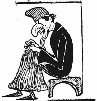
Οι άνομοι Έβραίοι.

Κάνει έτσι, μόλις μπήκε πάλι, ό Έσταυρωμένος στον Σταυρό, άχώρος και πικραμένος, μέ γυμμένο τό κεφάλι