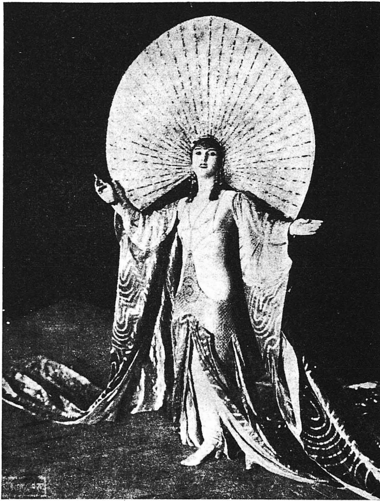
Ἡ περίφημος χορεύτρια Ἐντα Μεγγούλ, ἡ ἀποκαλυμμένη «Φῶς τοῦ Βορᾶ», μέ τήν πλουσιωτάτην χορευτική της ἀμφίεσιν.