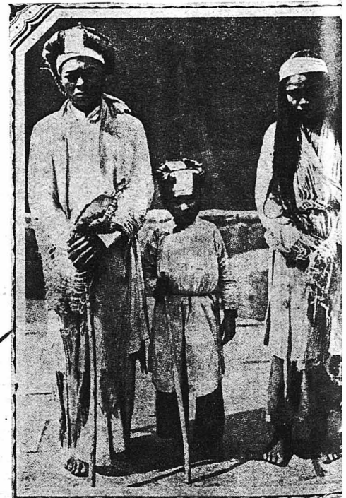
Πιστεῖ εἰς τήν ἀνάμνησιν τῶν νεκρῶν οἱ Ἄνν και οἱ κάτοικοι τοῦ Τογκίνου, πενθοῦν φέροντ τρία ἔτη λευκῆ τούρμπάνι και λευκά βαρετιά