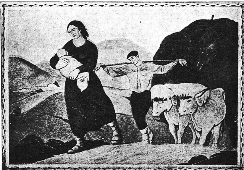
ΤΟ ΓΥΡΙΣΜΑ ΑΠΟ ΤΟΥΣ ΑΓΡΟΥΣ.— Γραφική εἰκὼν Γάλλου ζωγράφου, ἀπὸ τᾶς ἐκτεθείσας ἐσχάτως στὸ Παρίσι, στὴν Ἐκθεσί τῶν «Ἀνεξαρτήτων»