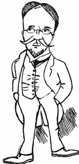
‘Ο Γαβριηλίδης (Σκίτσο τού έν Παρισίους διασήμου Έλληνος ζωγράφου Γαλάνη)

— «Πολύ μεγάλο, πολύ πρωτόλειο, ήμισια ένδιαφέρον».