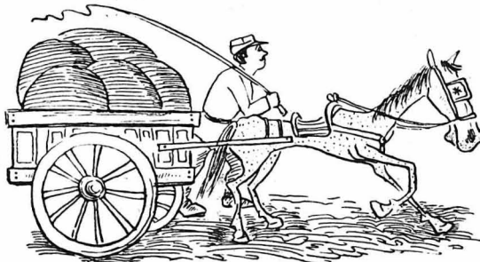
'Ησαν τά κάρρα της έφοδιοπομπής όπου περνούσαν

— 'Εχετε μανούλα και σεις καψόπαιδα, μάς ειπε.