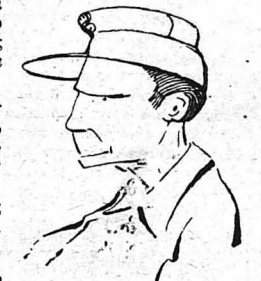
— Βρε τά βροχτοκούκια!

Κάτι σαγάνια που έπλυνε σιγά-σιγά, για να μη μάς ταράξη με νανουρίσανε