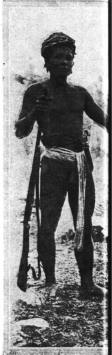
Δυὸ ἄγριοι τῆς νήσου Βόρνεο β. οὐ Μεγαλόσωμο, ἄχαρο, ψηλότερο στέ οὐ βρισκεται μόνον σὴν Νέαν Γουί εα