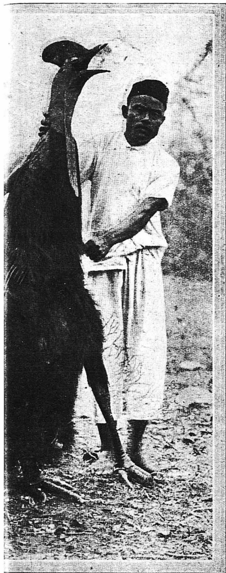
Ένα από τὰ παράξενα πουλιά τῆς νήσου των. κ' ἀπὸ τὸν πειρὸ ὕψηλό ἀνθρώπο, τὸ πουλι αὐτὸ ἦν Αὐστραλιαν, ὀνομαζέται δὲ «Κασογουέρι».