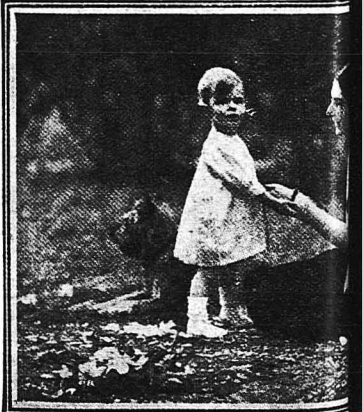
Ἡ πριγκίπισσα Ὑολάνδη, θυγατὴρ οὐ ταλίας καὶ σύζυγος τοῦ κόμητος Κό με τὸν μικρὸν υἱὸν τῆς εἰς τὸν κήπον