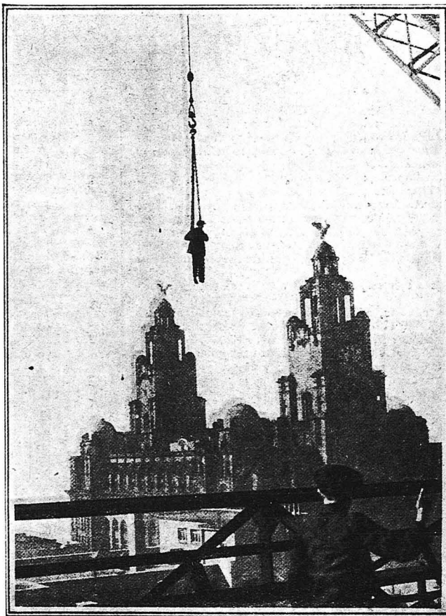
Εἶνε τόσο ὕψηλά τὰ κτίρια, τὰ ὁποῖα κτίζονται τελευταίως στὸ Λίβερπουλ ὥστε οἱ ἐργάται καταβαίνουν ἀπὸ τὰ ὕψη ὅπου ἐργάζονται με βίτση. Ἡ ἀνω εἰκὼν παριστᾷ ἀκριβῶς τὴν καθοδὸν ἑνὸς ἐργάτου.