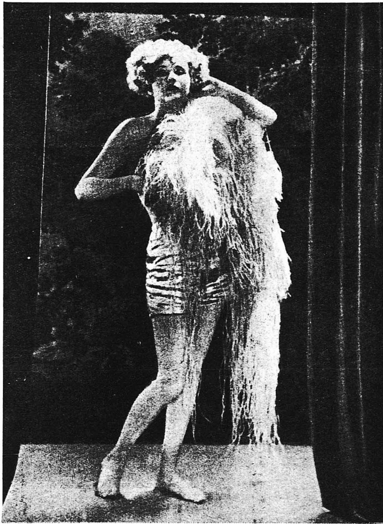
Ἡ Ἀμερικανὶς πρωταγωνίστρια τοῦ κινηματογράφου Τζόις Κόμπτον, ὅπως ἐμφανίζεται εἰς ἕνα νέον φιλμ με ἀμφίσειν λαμὲ ἄρσαν καὶ πτερά στρουθοκαμηλοῦ.