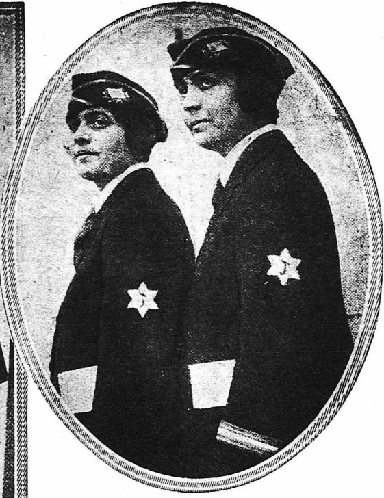
"Ανω εικόν. — Δύο περίφημες 'Αμερικανίδες πλοιαρχίνες εν στολή, υπηρετούσαι εις τὸν 'Εμπορικὸν στόλον τῶν 'Ηνωμένων Πολιτειῶν.