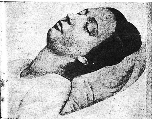
Ἀριστουργήματα τῆς Ζωγραφικῆς. Ἡ «Κοιμημένη», ἔργον τοῦ Ἰταλοῦ Ζωγράφου Τζιόρτζιο.