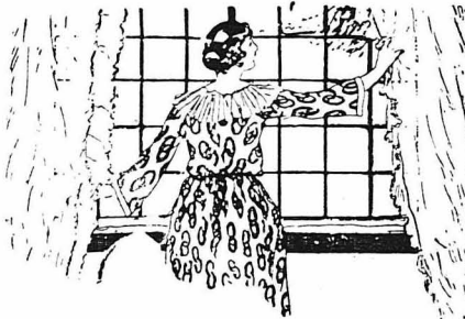
Ή νοσοκόμος τράβηξε τις κουρτινες