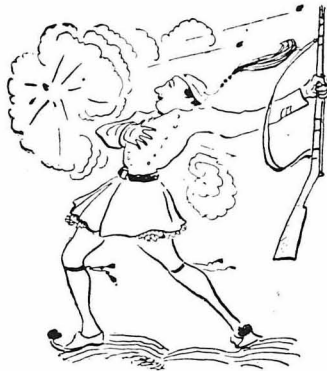
Μιά όβριδα τού έσπασε τó χέρι...

— Καλλίτερα νά πέθαινα,γιατρέ, παρ' ότσι σημαδεμένος ! Και έγυριζεν ό λοχίας στο στενόμακρο κρεβάτι του, κί' ετρί- ζανε τά σίδερα τής κλίνης. Ήταν ένας τετράψηλος λεβέντης και γιομάτος, μέ μιá νόστιμη άνδρική μορφή, που ό ήλιος τήν ελεγε ξεροκοκκινίσει, σάν καρβέλι σιταρένιο. Τόν έπονούσε κανέναν ή καρδιά, νά βλέπη τέτοιο σώμα, μεστό από ζωή, νά κοιτεται στο στώμα, νά δέρνεται και νά χα- ροπαλαίη ! Γύρω - γύρω στά άλλα τά κρεβάτια, τρεις-τέσσαρες άλλοι, εϋ- ζωνοι και αυτοί, πληγω- μένοι, μέ φασκιωμένα τά χέρια και τά πόδια τους, έμεναν άκίνητοι και σιω- πηλοί, σάν καταπτοημέ- νοι από τού λοχία τον τό πέσιμο, βουβοί από τήν συμφορά του, τήν με- γάλη.