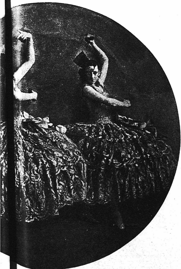
ελφά... χουν ξετρελλάνει με τούς χορούς των τούς 'Αθηναίους ...σκηνήν τής επίθεωρήσεως «Μπέν ζοϋρ Παρί».