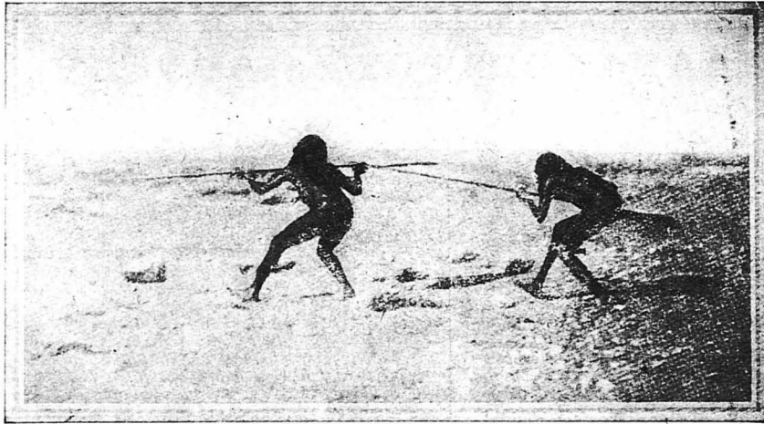
Ένας αγών μέχρι θανάτου μεταξύ αγρίων της Πελονησίας χρησιμοποιούντων όπλα του τόπου των