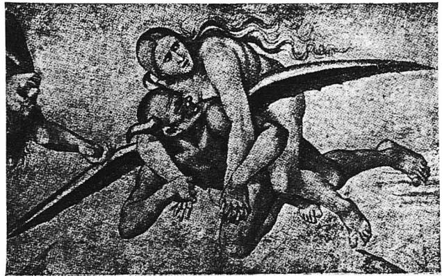
Μία δπέρροχος τοιχογραφία ναού τής Φλωρεντίας παριστάνουσα τόν Διάβολον μεταφέροντα εις τήν Κόλασιν άμαρτωλήν γυναίκα !