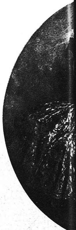
Ἡ δύο Ἰσπανίδες ἀδελφὲς στὸ «Ντελίσ», ε