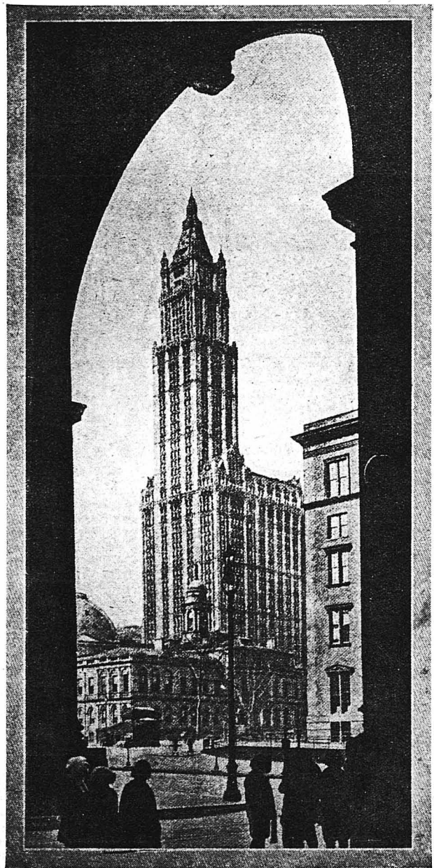
Ένας άπό τούς πλέον θαυμαστούς ούρανοξύστας τής Νέας Υ- όρκης, μέσα εις τόν όποιον στεγάζεται πληθυσμός άνάλογος με μιάς πόλεως τής 'Ελλάδος.