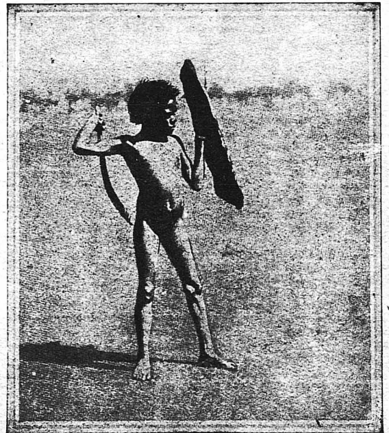
Γυμναζόμενος μετὰ τὰ πρωτογενῆ ξύλινα ὄπλα τῆς χώρας του. Παρόμοια ὄπλα ἐχρησιμοποίησαν καὶ οἱ πρῶτοι ἄνθρωποι κατὰ τὴν «Ἐυλίην Ἐποχὴν».