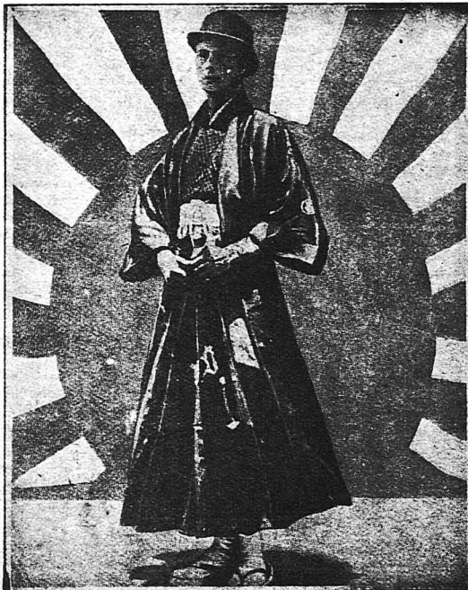
Με στολή γιαπωνέζικη κατά τὸ τελευταίον του ταξιδίου στὰς Ἰνδίας καὶ στὴν Ἀπὸ Ἀνατολή. Ἡ φωτογραφία ἐλήφθη ἐπὶ τοῦ ὑπερωκεανείου, τοῦ ὁποίου ἐπέβαινε ἐπιστρέφων στὴν Εὐρώπῃ.