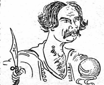
- Εἶπα κ' ἐγὼ ἄς καθαρίσω τὸ δικὸ μου !