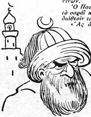
— Μπέη μου καὶ Πασσά μου!

— Πρέπει νὰ βασιανισθῆς, νὰ μαρτυρήσῃς, γιὰ νὰ στεφανω-θῆς μὲ τὸν φωτιστόφαναρον τοῦ μαρτυρίου, τοῦ εἶπεν ὁ Παπ - αμε-