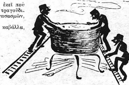
*Όχι, επέσαμε σε... τραζανά

Μιά ήμερα, που άγχομαζόντας άνέβημνε ένα γκρεμό, λαγανιασμένος, πεινασμένος, φρόφις έντελώς, με τ'ά μαλλιά μακρυνά, σάν νά χυνόντουσαν από τ'ό πηλίο του, του ειπα έτσι για δοκιμή, για νά ιδώ, τί θά μου άπαντήση. — *Υποφέρετε, Γιώτα; — *Υποφέρω!.. — Σάν σου ξαναρέσει κ'όναζε «ζήτω ο