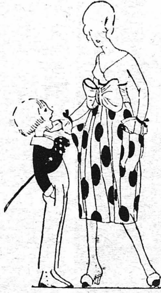
— Πόσω χρονών είσαι ;

Το τραίνο σταμάτησε. "Ενας επιβάτης άνοιξε την πόρτα του βαγονιού και βγήκε στον έξωστη να κατεβή. Η Κυρία ερχότανε δεύτερη. Μα μόλις πρόβαλε στο άνοιγμα της πόρτας κ' άμέσως άφησε μια ανιγμένη φωνή, σβύκατρα έκανε να τραβηχτή