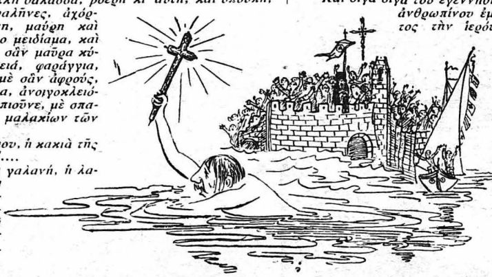
Κρατώντας τόν σταυρό ψηλά πού άστραφτε: στόν ήλιο!..