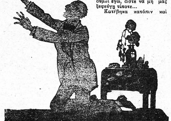
“Είπα κοντά της και την άγγιξα...”