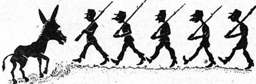
*Ἀποσπάσματα στρατοῦ καὶ χωροφυλακῆς.