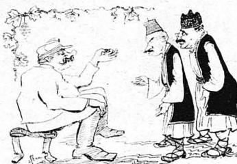
— Μόνο μιά σπληνοῦν, μὰ λίγη, λίγη, τόση δά !...

Ἐπειδὴ ὅμως τὸ ἔγχιλημα ἦταν τέτοιον, ποῦ συνετάραξε τὴν Κοινωνία, ἔλαβε μέρος πλέον εἰς τὴν καταδιώξιν καὶ ὁ στρατός. — Καὶ ἐπειδὴ αἱ στρατιωτικαὶ ἀρχαὶ εἶχαν πληροφῆρις ὅτι οἱ κανοδο- γοὶ ἐκρίβοντο εἰς τὸ αὐτὸ χωριό καὶ μάλιστα στὸ Κλασενιῶτικὴν τὴν οἰκία, ἀποσπάσματα στρατοῦ καὶ χωροφυλακῆς, ἐφθᾶσανε νύχτα