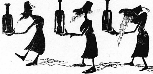
Νά τοις φέρη ό καθε ένας από ένα γαλονί κρασί.

Εβέναμε, κατάλυμα, σ' ένα Ίσραηλικο σπίτι της Καστοριάς. Η γραία Ίουδαία του σπιτιού, μās έπεριποικετο κατά δύναμιν. Το βράδυ ήρχετο και ο υίός της και εκάθημεθα όλοι στο τζάνι ψήνοντας κάστανα και ουζετιούντες. Η νύχτες, νύχτες χειμωνιάτικες, μακρές και κρύες, περνούσαν με ιστορίες ευθύμες.