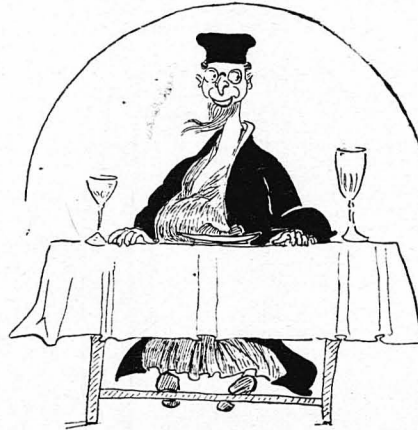
Εκάθησε γυμνάτος όρεξιν εις τό τραπέζι.

Άλλος ιατρός, Γάλλος, διηγείται ότι ειπε ένα στρατιώτη νεκρόν, του όποιοι η σφαίρα ειχε κόψει άριστερά τό αιμοσφάρα και ειχε κόψει με τό δεξιό με τό πρόσωπο και τα μάτια υφωσμένα κατά τον οφθαλμό, τα χέρια ένωμένα, τα δάχτυλα δεμένα. Ήταν φανερό πώς ό θάνατος τον βρήκε προσευχόμενον.