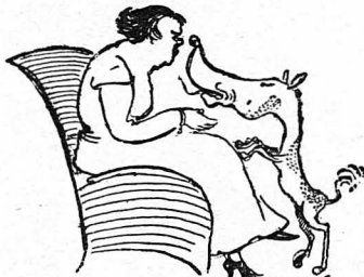
— Τι χαριτωμένο ποῦνε !...

Μιά φορὰ, μιά οἰκογένεια, εἶχε καλέσει μιά ἄλλη σὲ τραπέζι. Τελευταίως εἶχαν γνωρίσει, και κρατοῦσαν ἀκόμη τούς τύπους και τίς ἐτικέτες. Καθὸς ἢ προσκληθῆσαι οἰκογένεια, εἰσῆλθετο σὲ τὸ σπίτι, τὴν ἠκολούθησαν και ἕνα ἀγνωστο σκυλί τὸ ὄρομου. Ἔτσι ἀπὸ τύχη !... Οἱ οἰκοδεσπότες, νομίσαντες δι τὸ σκυλί, εἶνε τῶν προσκεκλημένων, τὸ ἀφῆκαν νὰ εἰσελθῆ και νὰ μῆ και σὲ τὸ σαλόνι. Οἱ ἔξιοι νομίσαντες δι τὸ σκυλί εἶνε τῶν οἰκοδεσποτῶν τὸ εὐώπευον. Στὴν καθῆσαν σὲ τὸ τραπέζι, ὁ σκύλλος ἐνθαυρνθεὶς ἀπὸ τὰς θαυκαίαις και τὴν καλωσύνην ποῦ τοῦ εἶδειαν, προσεστρίβετο εἰς ὄλους και ἄλλους τὸ κεφάλι του, και ἄρπαζε και κανένα κομμάτι ἀπὸ τὸ τραπέζι.