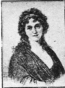
Ἡ κόμησσα Ἀλμπρίτζι.