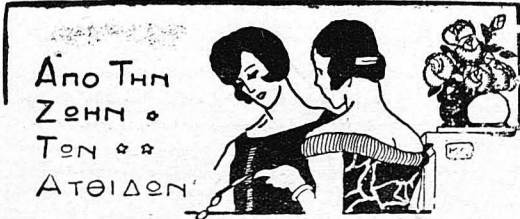
ΣΙΛΟΥΕΤΤΕΣ ΑΠΟ ΤΑ ΣΑΛΟΝΙΑ