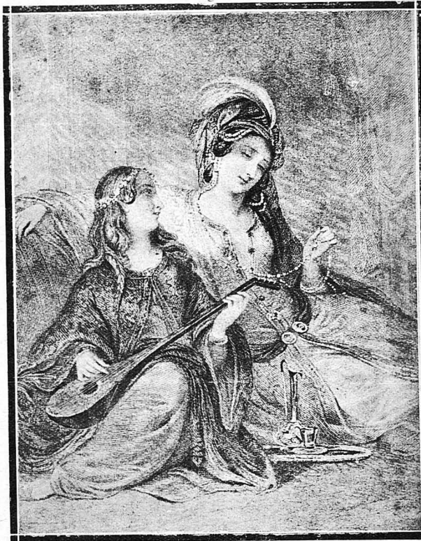
Η Σουλτάνα Έλέγκω (Εκ παλαιάς ζωογραφίας)

Ο Μωάμεθ μεγαλοκόξος και άπορτηγών τάς έννοχλήσεις των βασιλικών φροντίδων, τύπος ένθυμίζων τον Κάρολον τον 9ον της Γαλλίας, άφησε την μητέρα του να ένεργή όπως ήθελε. Η Ισχή της Μπάφρας έφθασε τότε εις τό κατακόρυφον. Είχε προσεταίριση τους Γενιόταρους και τους Ισχυροτέτους πασάδες. Αυτή διητύθηκε από τό σαράγι τον λαβόντα χώραν τότε πόλεμον της Τουρκίας κατά της Ογγαρίας και παρά την έπαικοουθήσαν ήταν κατάθρονος να μη χάζη την δύναμιν της. Έσακούσε άλλόκοτον γοητείαν επί του λαού. Τό θάρρος της ήτο τόσοσν ώστε εις τάς έορτάς που όφρανώθησαν μετά την ήταν διά να λησιμονήση ό λαός τά δαινά του