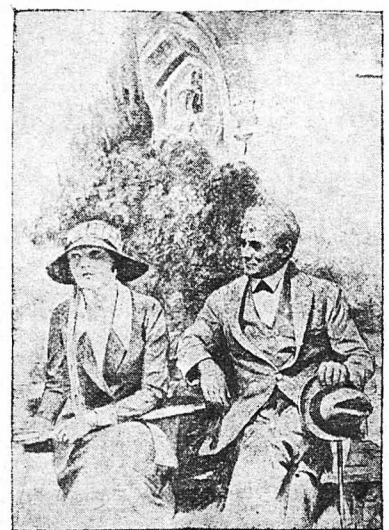
κόρη τοῦ Κουερτῶ εἶχε αὐτοκτονήσει σὶ Παρίσι!