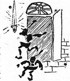
Σάν έμειναν αυτοί από τήν πόρτα κείνοι φεύγαν από τ' ά- παράθυρο.