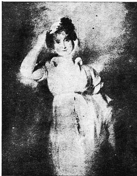
Ἡ Καρολίνα τῆς Ἀγγλίας

Τὸ 1806 ὁ Βασιλεὺς Γεώργιος ὁ 3ος διέταξε ἐπεινα ἀπὸ ἀπατήνης τοῦ πριγκίπκος τῆς Οὐαλλίας νὰ ἐνεργηθοῦν ἀνακρίσεις κατὰ τῆς πριγκίπισσης. Ἡ Καρολίνα κατηγορεῖτο διὰ στοιχείων πού εἶχαν καταρτίσει οἱ ἄνθρωποι τοῦ πριγκίπκος, ὅτι εὐρίσκειτο εἰς ἐρωτικὰς σχέσεις με τὸν λοχαγὸν Μάμπυ, τὸν ναύαρχον σὲρ Σίννεϋ