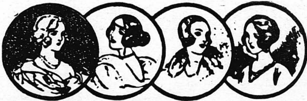
ΣΙΛΟΥΕΤΕΣ ΑΠΟ ΤΑ ΣΧΙΛΟΝΙΣ