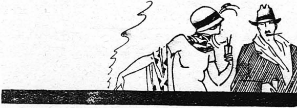
ΣΙΛΟΥΕΤΤΗΣ ΑΠΟ ΤΑ ΣΑΛΟΝΙΑ