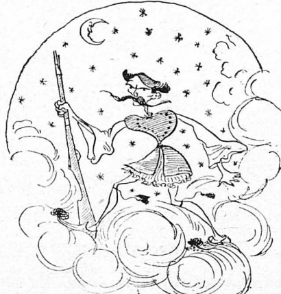
Θὰ εὐρεθῆ γιὰ Θεοῖς ἀγοροφύλακος!

Ὁ γάμος εἶναι ἀνοησία; πού διαπρᾶττεται ἀπὸ δύο καὶ κατόπιεν ἓνα κᾶτεργον γιὰ τρεῖς καὶ περισσοτέρους. Σαίξπηρ.