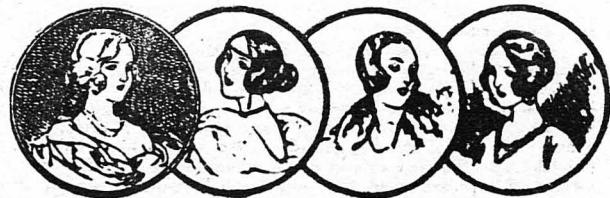
ΣΙΛΟΥΕΤΤΗΣ ΑΠΟ ΤΑ ΣΑΛΟΝΙΑ