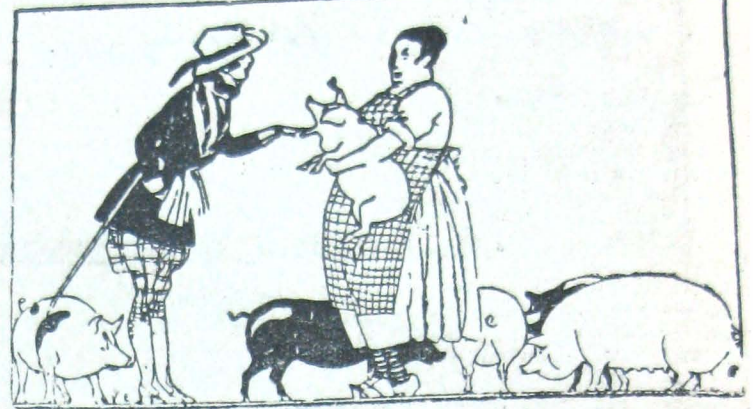
Η ΑΝΕΚΑ ΤΙΣ ΑΥΤΟΒΙΟΓΡΑΦΙΑ