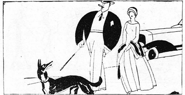
Ο ΔΙΑΓΩΝΙΣΜΟΣ ΜΑΣ ΚΑΙ Η ΠΡΑΓΜΑΤΙΚΟΤΗΣ