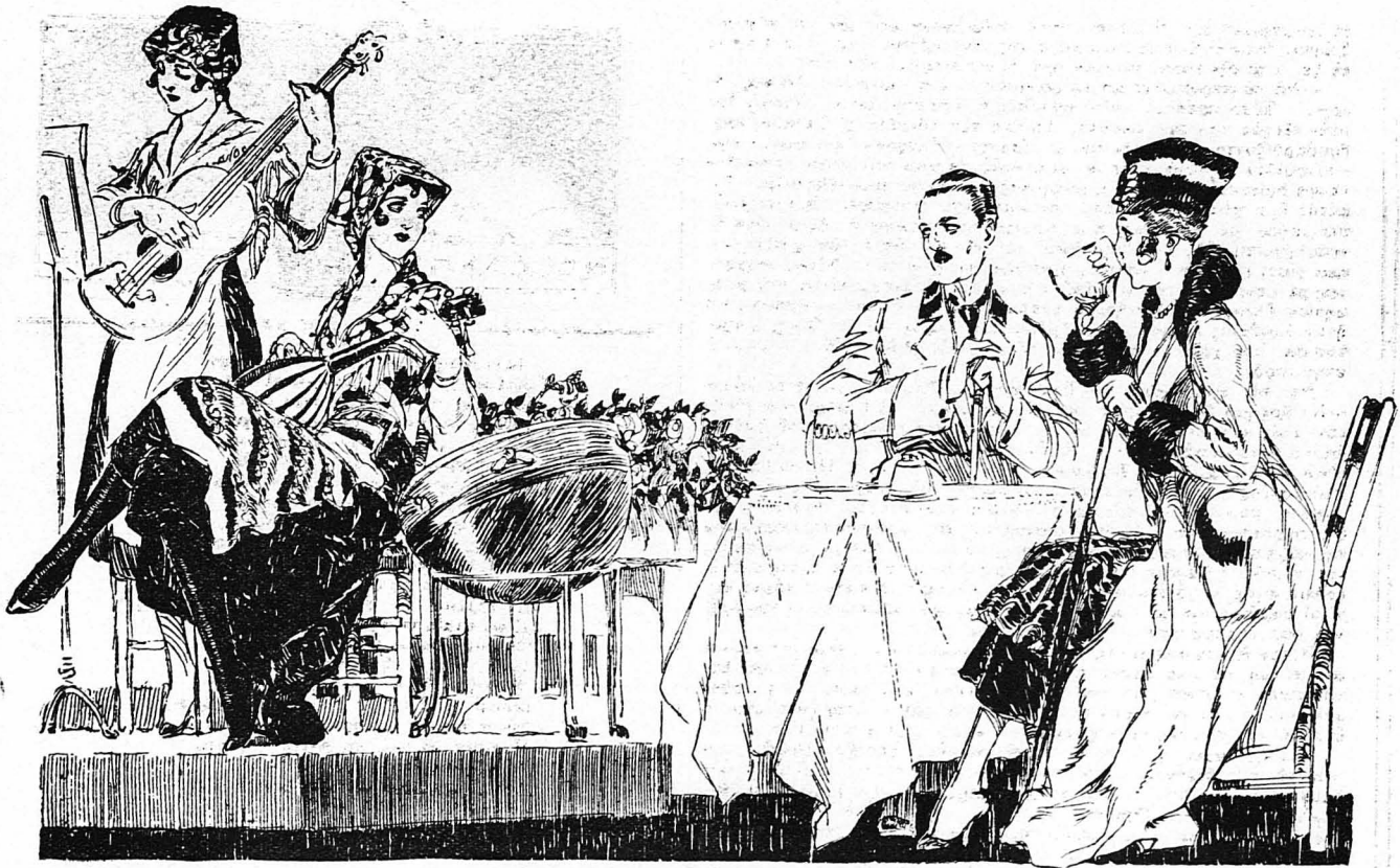
Τὴν παρέσυραν στὰ γλέντια καὶ στοὺς χορούς...