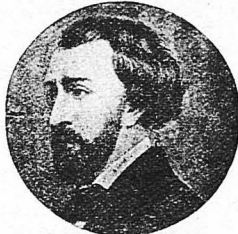
Άλφρέδος Ντέ Μυσσέ